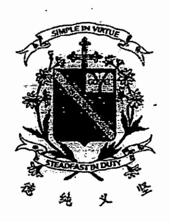
2015 三年级高级华文年中考试 试卷二:语文理解与运用 (第二部分)