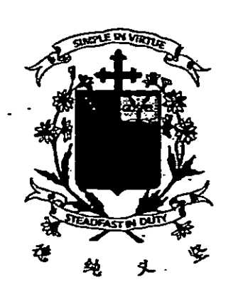
2015 三年级高级华文年终考试 试卷二:语文理解与运用 (第一部分)