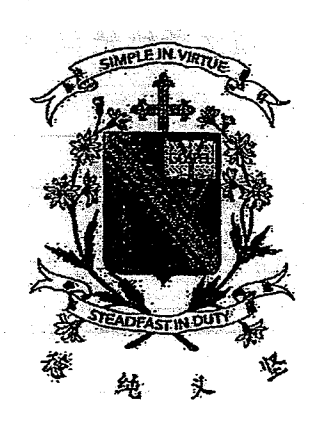
2018 五年级高级华文年中考试 试卷二:语文理解与运用

考试日期: 2018年5月11日考试范围: 第一课至第十课作答时间: 1小时20分钟